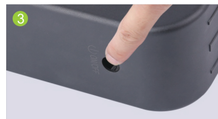
③ Appuyer sur l'interrupteur pour que la lumière s'allume automatiquement à la tombée de la nuit.