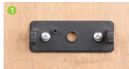
① Figure 1 : Le support est fixé.