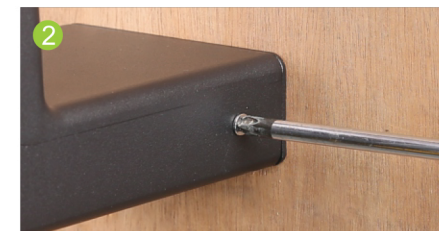
② Placer le support de la lampe et serrer les vis des deux côtés.